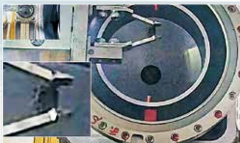
取り出し装置で掴んだ約5ミリのデブリを運搬用ボックスに回収する様子(2024年11月6日)

復興とは、事故・事象があった以前より良い状態にする事であると考えます。表面的な復旧はしていても復興までは…。これが私の感じる復興の現状・現実です。