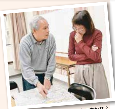
ハザードマップ、自分の所は大丈夫かな？

震災が起こった時、我が家には小さな子どもがいると知っている近所の方がみかんをくれたり、ミルクに使う暖かいお湯や毛布をくれました。日頃から必ず「こんにちは」、「今日暑いね」と挨拶をしていた為、自然と我が家には子どもがいることのアピールができていたと思います。今振り返ると地域の皆さんは本当に優しくたと実感します。