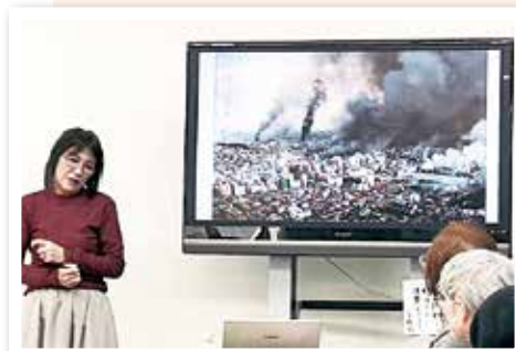
当時の写真で振り返り今気づくこと

阪神淡路大震災を経験した神戸市職員OBにより結成された団体です。消防職員として、事務方として、また学校の教員としてそれぞれ経験したことを次世代へ伝える活動をしています。