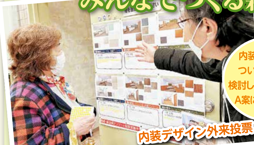
内装デザイン外来投票