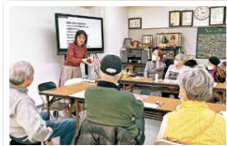
今後来る南海トラフ地震に備えましょう

皆さんには地域の防災行事にぜひ参加していただいて、自分の住んでいる地域がどういふうに災害時の取り決めをしているのかを知ってほしいです。地域行事に参加してご近所さんと顔見知りになる機会を作ってください。