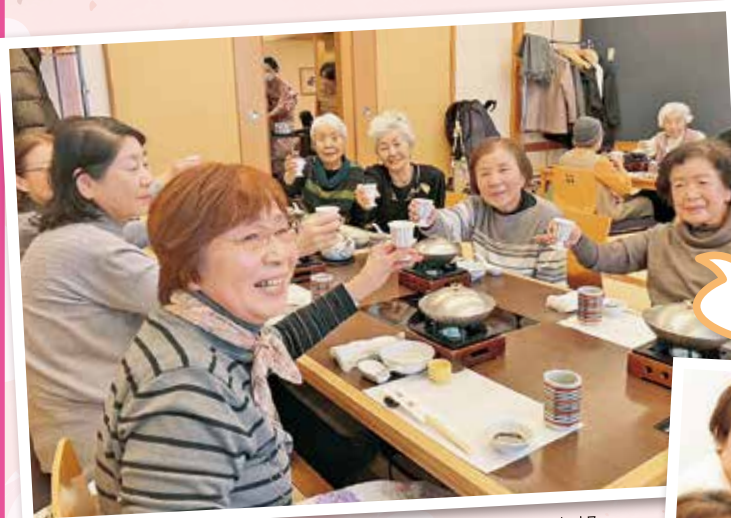
おおえぼし班が再開し賑わいを増す西郷支部

今年も地域組合員と職員組合員と一緒に、ろっこう医療生協で、地域まるごと健康づくりをすすめましょう！ 1月9日进行かわきりに、8支部が新春のつどい、3ブロックが総代のつどいを開催し、約300人の組合員が集いました。自己紹介、演奏、ビンゴゲームなど、楽しい企画とおいしい食事、今年も元気にスタートしました。