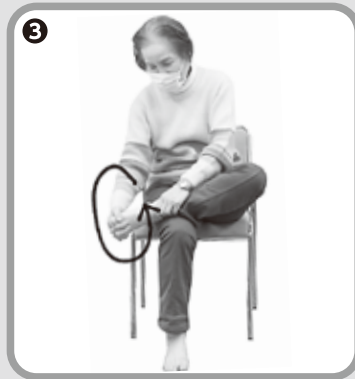
③ 足の指と手の指を絡め、グルグル回す