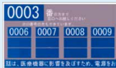
待ち状況をモニター表示。手元の番号札で確認できます