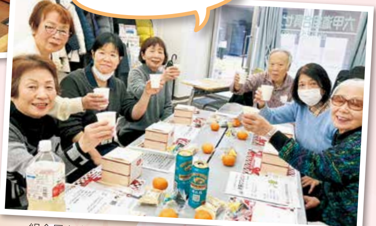
組合員と職員がいつも一緒、仲良くスタート六甲南支部