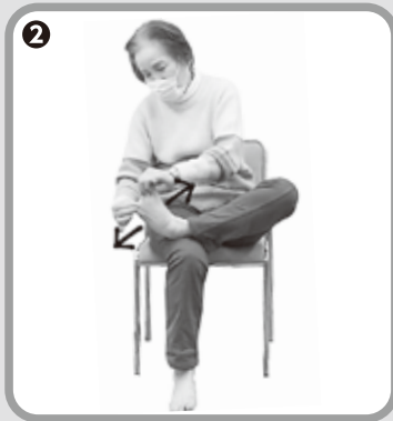
② 足の指の間を手で広げる