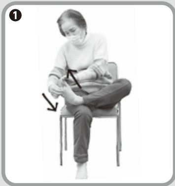
① 足の指2本を持ち、前後する