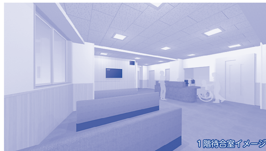
1階待合室イメージ