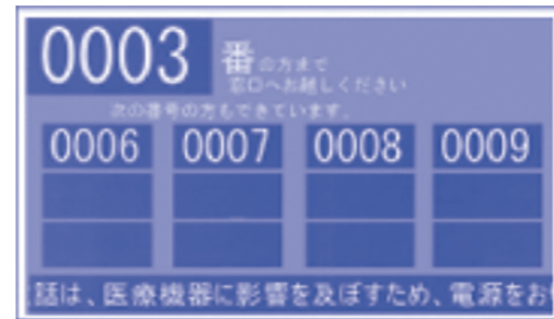
待ち状況をモニター表示。手元の番号札で確認できます