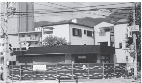
▲着々と工事が進む小規模多機能とががわ

「小規模多機能とががわ」のご利用をお考えの方へ 小規模多機能とががわの利用をご検討中の方は下記までご連絡ください。 職員募集 利用者さんが安心して暮らせるようにサポートしてください! 常勤職員・準職員・パートタイム・夜勤専門介護職員 募集中 小規模多機能とががわ準備室 (生協本部) 電話 802-3424